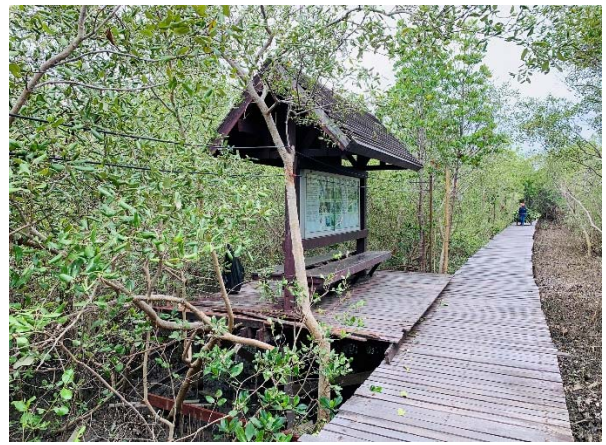
ก่อนดำเนินการ